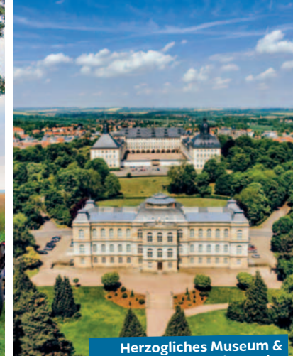
Herzogliches Museum & Schloss Friedenstein, Gotha