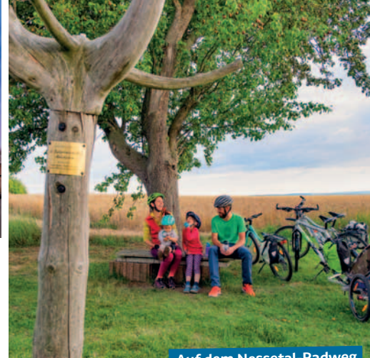
Auf dem Nesselal-Radweg